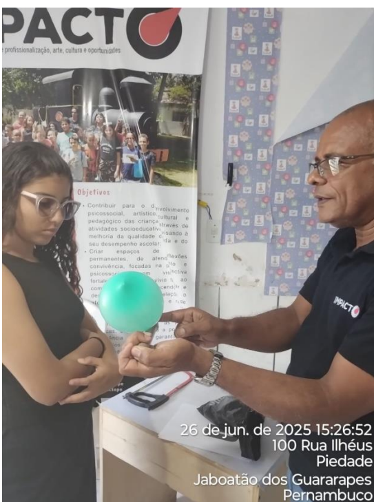
26 de jun. de 2025 15:26:52 100 Rua Ilhéus Piedade Jaboatão dos Guararapes Pernambuco