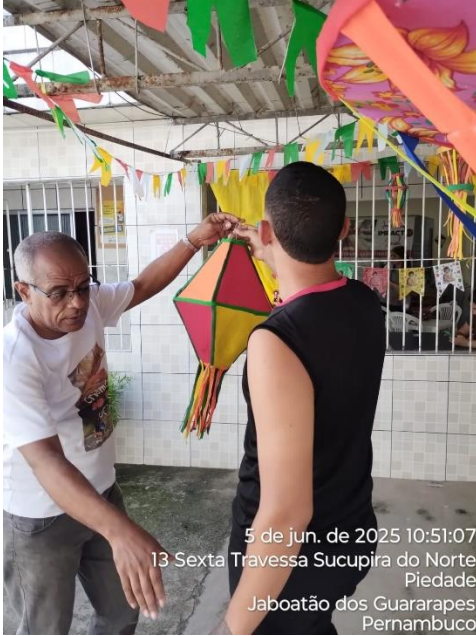
5 de jun. de 2025 10:51:07 13 Sexta Travessa Sucupira do Norte Piedade Jaboatão dos Guararapes Pernambuco