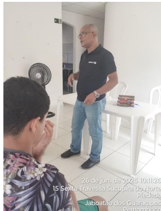
26 de jun. de 2025 10:11:26 15 Sexta Travessa Sucupira do Norte Piedade Jaboatão dos Guararapes Pernambuco