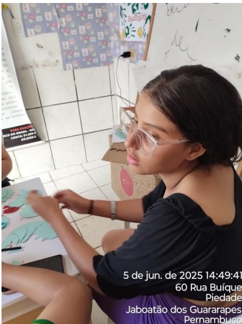
5 de jun. de 2025 14:49:41 60 Rua Buíque Piedade Jaboatão dos Guararapes Pernambuco