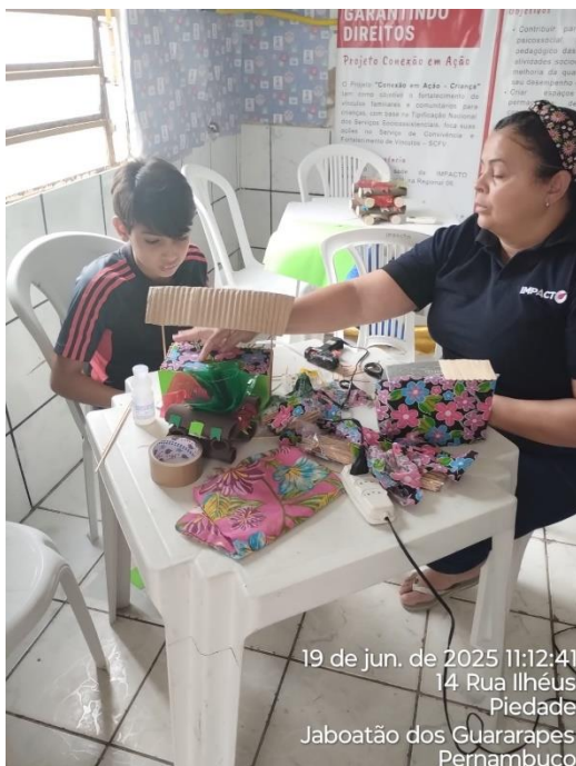
19 de jun. de 2025 11:12:41 14 Rua Ilhéus Piedade Jaboatão dos Guararapes Pernambuco